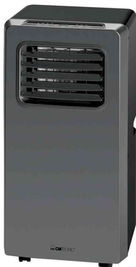
Climatiseur CL 3672