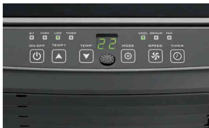
Visuel de référence: présente l'écran LED en utilisation