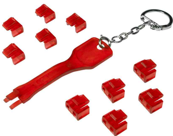
Verrou de sécurité port RJ45, 1 clé / 10 verrous