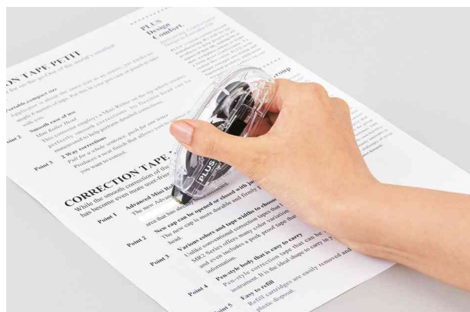
Visuel de référence: utilisation du roller correcteur "DS"