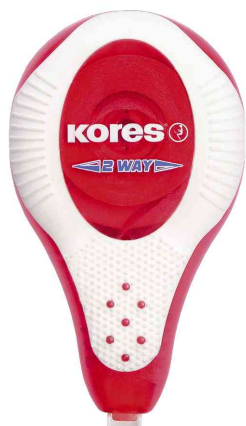
Roller correcteur 2 way