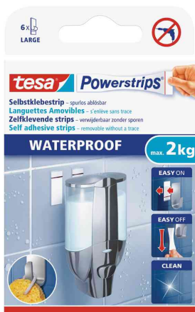
Powerstrips Pastilles adhésives LARGE WATERPROOF