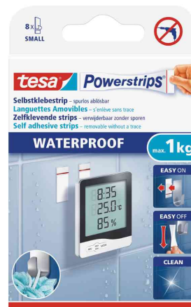
Powerstrips Pastilles adhésives SMALL WATERPROOF