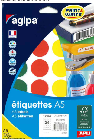
Pastilles de couleur, diamètre: 30 mm