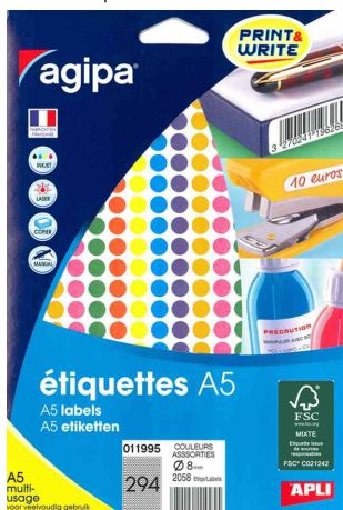
Pastilles de couleur, diamètre: 8 mm