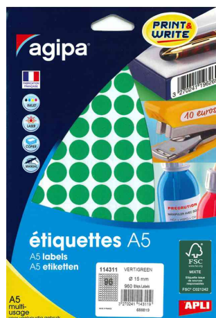
Pastilles de couleur, diamètre: 15 mm