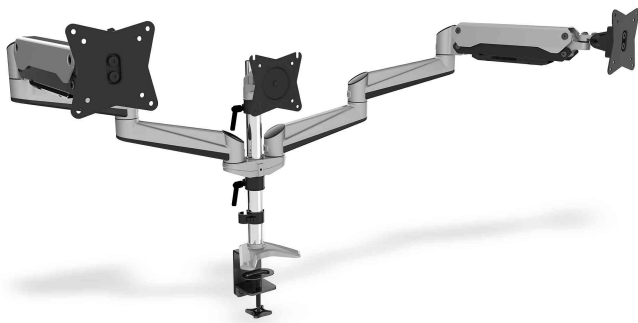
TFT/LCD Monitorarm mit Gasdruckfeder

- für die Montage von bis zu 3 Bildschirmen