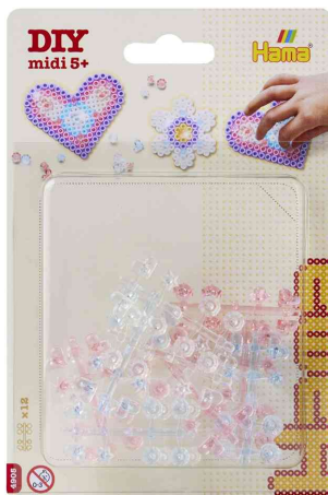
Verzierung für Bügelperlen midi "Juwelen", im Blister

ACHTUNG! Nicht geeignet für Kinder unter 36 Monaten, wegen verschluckbarer Kleinteile.