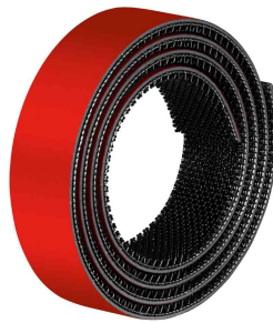
Klettband Ultra Power Lock Tape