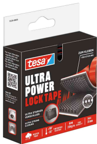
Klettband Ultra Power Lock Tape, Verpackung