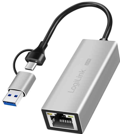
USB auf RJ45 Ethernet-Netzwerkadapter

- für reibungslose Videokonferenzen, Streaming oder Dateiübertragungen