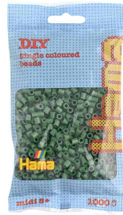
Bügelperlen midi, im Beutel - waldgrün