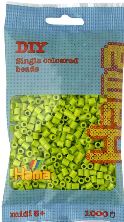
Bügelperlen midi, im Beutel - lime