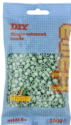
Bügelperlen midi, im Beutel - eukalyptus

ACHTUNG! Nicht geeignet für Kinder unter 36 Monaten, wegen verschluckbarer Kleinteile.