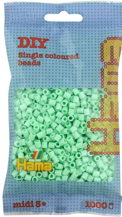
Bügelperlen midi, im Beutel - pastell-mint