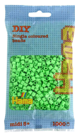
Bügelperlen midi, im Beutel - pastell-grün