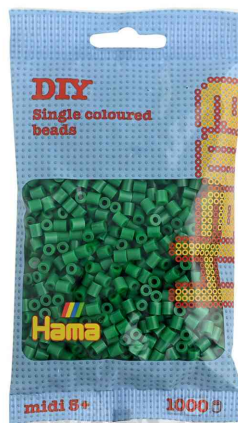
Bügelperlen midi, im Beutel - grün