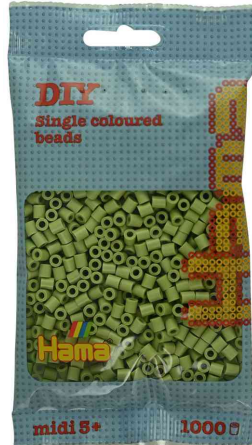
Bügelperlen midi, im Beutel - matcha