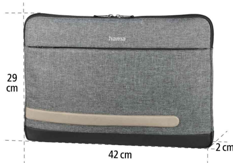
Notebook-Sleeve "Terra", Maße