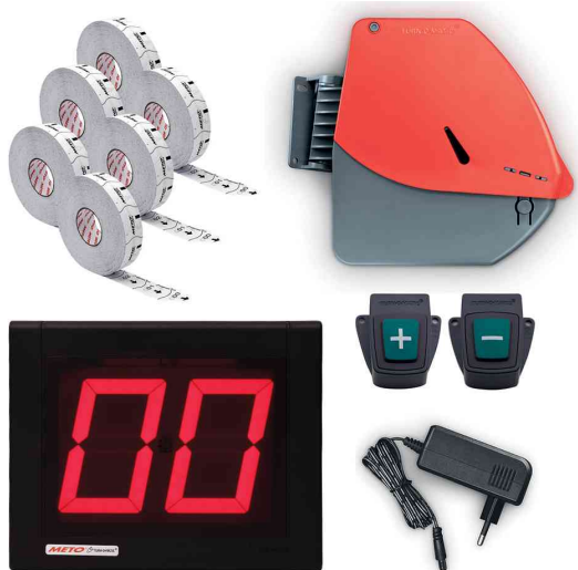
Ticket-Spender Turn-O-Matic, Starterpack