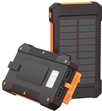
Mobiler Zusatzakku mit Solar