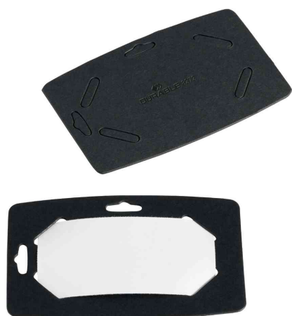
Namensschild aus Recycling-Papier