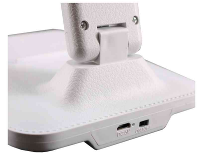
Detailansicht: Anschluss / Oberfläche