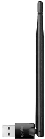
USB - Bluetooth 5.3 Adapter