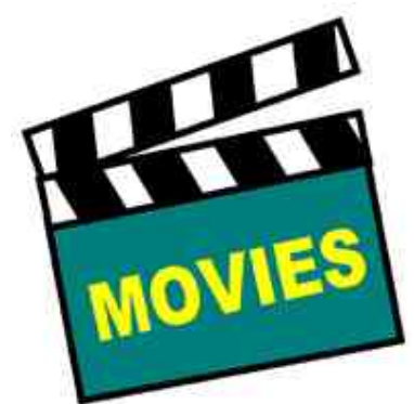
Film: zeigt das Produkt in Anwendung (6700288)