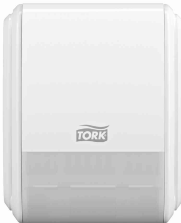
Spender ELEVATION für Lufterfrischer