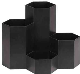
Multiköcher HONEYCOMB, schwarz