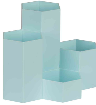
Multiköcher HONEYCOMB, türkis