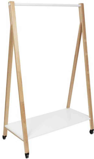
Garderobenwagen "SLEEK", mobil

- geeignet für Büros, Empfangsräume oder zu Hause