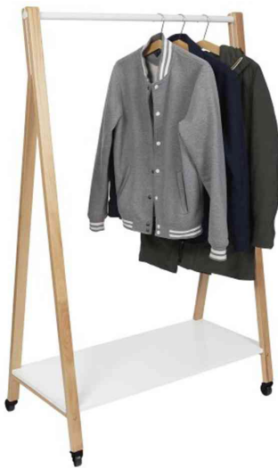
Garderobenwagen "SLEEK", Anwendungsbeispiel