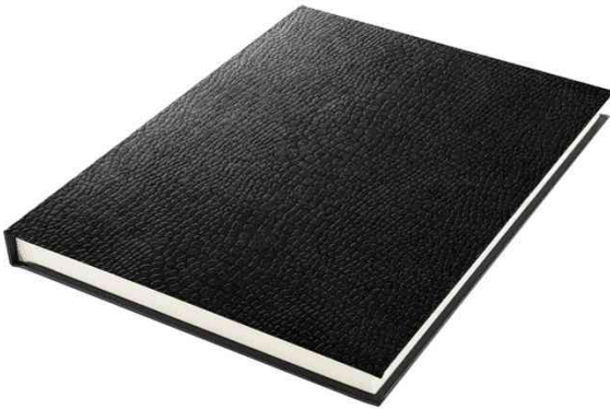
Skizzenbuch in Schlangenleder-Optik