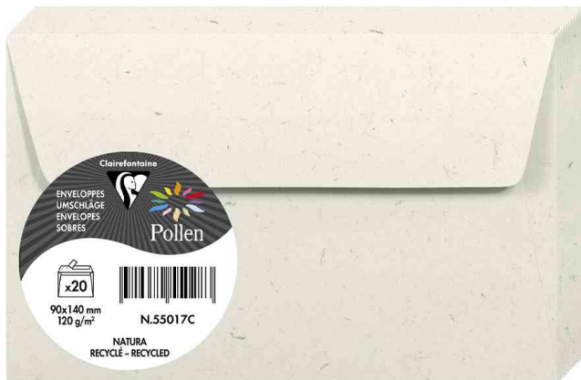
Briefumschläge Natura, 90 x 140 mm