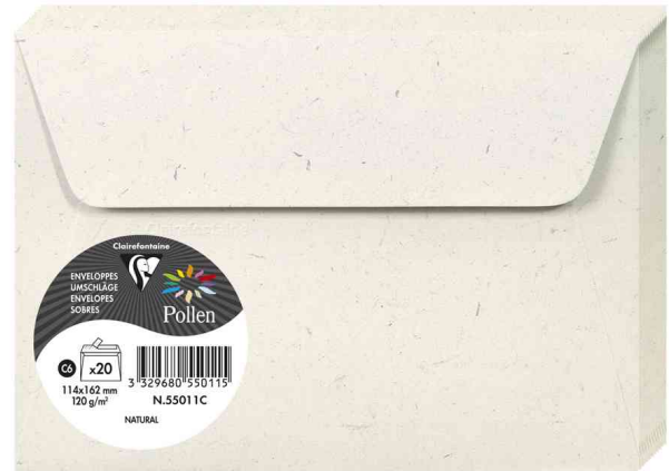
Briefumschläge Natura, 114 x 162 mm