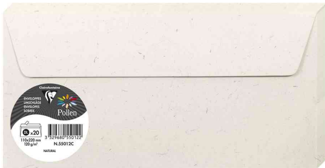
Briefumschläge Natura, 110 x 220 mm