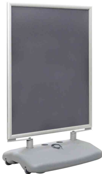
Kundenstopper SWING, grau