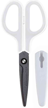
Universalschere Fitcut Curve Fluor