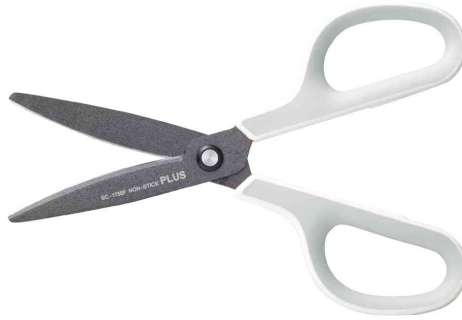
Universalschere Fitcut Curve Fluor