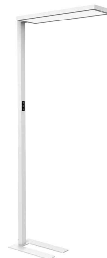
LED-Standleuchte MAULsenja, weiß