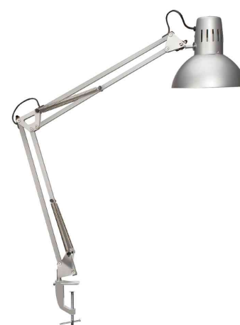
LED-Tischleuchte MAULstudy, silber