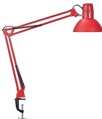
LED-Tischleuchte MAULstudy, rot