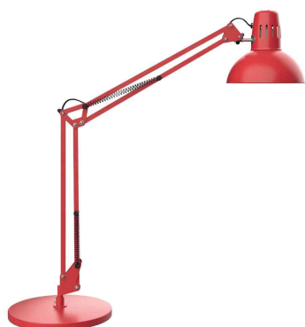
LED-Tischleuchte MAULstudy, rot