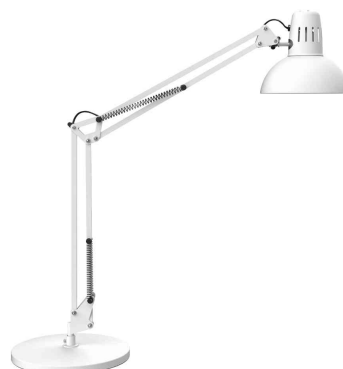
LED-Tischleuchte MAULstudy, weiß