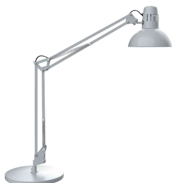
LED-Tischleuchte MAULstudy, silber