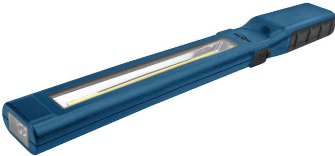
LED-Werkstatt-Stableuchte WL450R slim