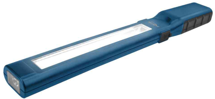
LED-Werkstatt-Stableuchte WL450R slim