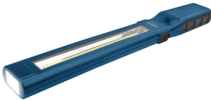
LED-Werkstatt-Stableuchte WL450R slim