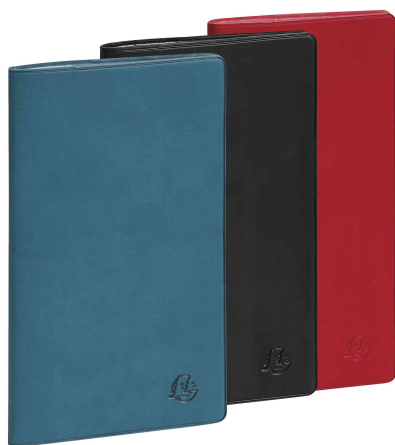
Agenda de poche "EXAPLAN 16" Winner, assorti