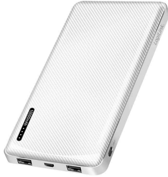
Mobiler Zusatzakku, weiß