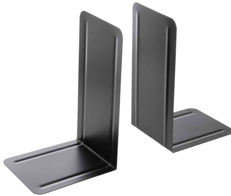
Buchstütze, (B)127 x (T)145 x (H)240 mm, schwarz