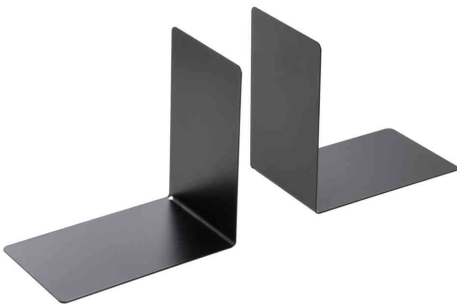
Buchstütze, (B)90 x (T)140 x (H)140 mm, schwarz