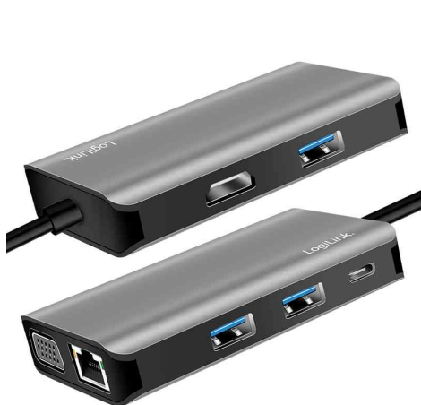
USB 3.2 (Gen 1) Docking Station, 7-Port

- UHD-4K-Projektoren- und Monitore, SD-Karten, Lautsprecher, Headsets und USB-Flash-Laufwerke können an das Notebook angeschlossen werden