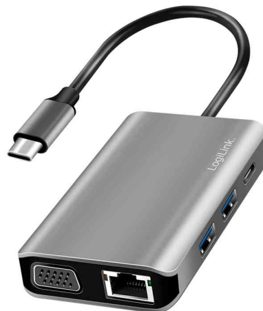
USB 3.2 (Gen 1) Docking Station, 7-Port