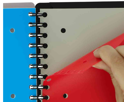
Detailsicht: versetzbares Register