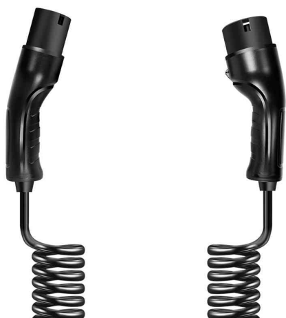
E-Auto-Spiralladekabel, Typ 2, 3-phasig

- geeignet für Fahrzeuge von Tesla, Audi, Mercedes-Benz, BMW, VW, Porsche, Renault, Citroen, Peugeot, Ford, Opel, Chrysler, General Motors und weitere