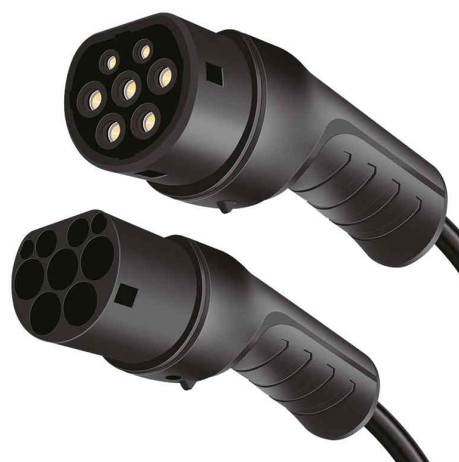
E-Auto-Spiralladekabel, Typ 2, 3-phasig