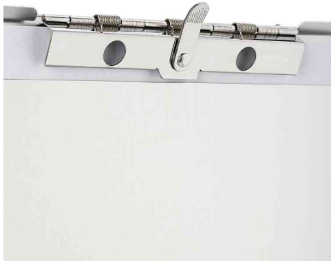
Detailansicht: gezahnte Klemme