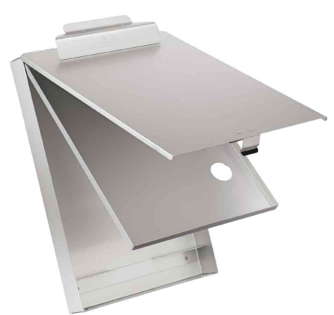
Formularhalter mit Box, offen