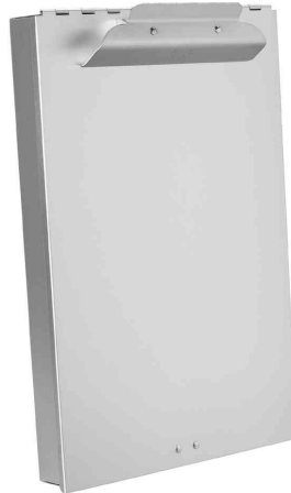
Formularhalter mit Box