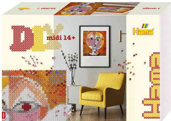
Bügelperlen midi Art "Paul Klee", Geschenkpackung

ACHTUNG! Nicht geeignet für Kinder unter 36 Monaten, wegen verschluckbarer Kleinteile.