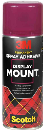
Sprühkleber DISPLAY MOUNT