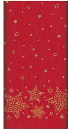
Weihnachts-Tischdecke "Christmas Shine", rot