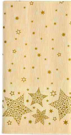
Weihnachts-Tischdecke "Christmas Shine", creme