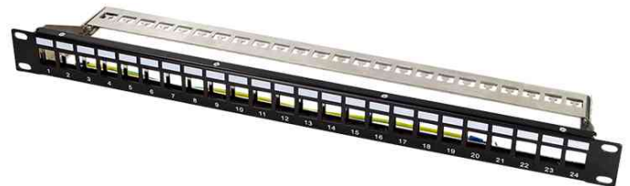
19" Keystone Patch Panel, schwarz