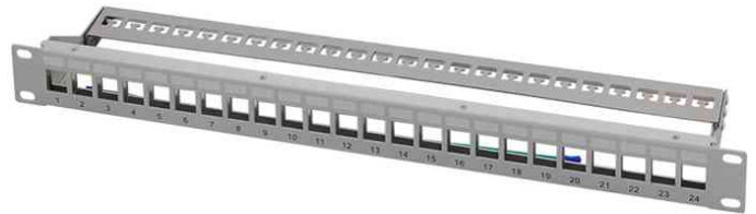
19" Keystone Patch Panel, lichtgrau