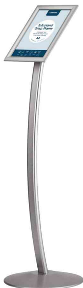
Infoständer mit Klapprahmen, gebogen