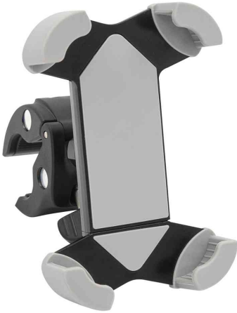
Fahrrad-Smartphonehalterung "Clip it bike"