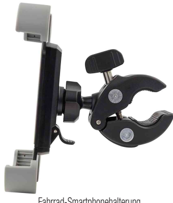
Fahrrad-Smartphonehalterung "Clip it bike", Seitenansicht