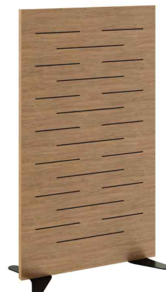
Akustik-Holztrennwand, (B)1.400 mm (Füße nicht im Lieferumfang)