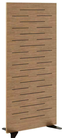
Akustik-Holztrennwand, (B)1.800 mm (Füße nicht im Lieferumfang)