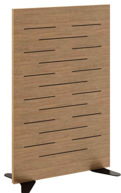
Akustik-Holztrennwand, (B)1.250 mm (Füße nicht im Lieferumfang)