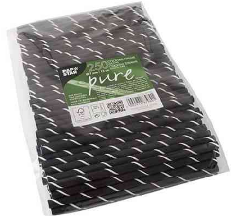
Papier-Trinkhalme "pure", Verpackung