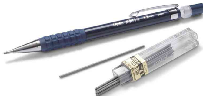
Lieferumfang: Druckbleistift und Minen