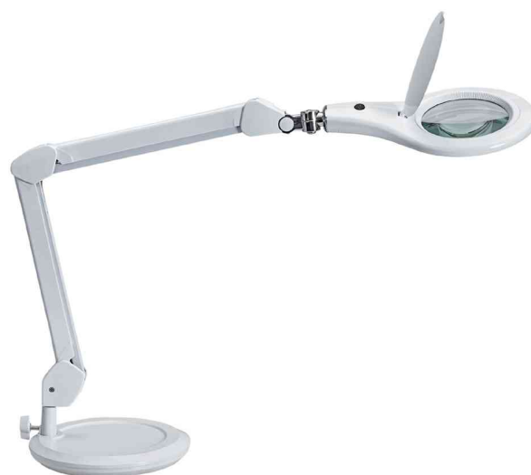
LED-Lupenleuchte MAULmakro, weiß