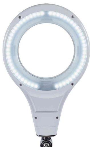
Detailansicht: Leuchtenkopf, weiß