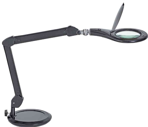
LED-Lupenleuchte MAULmakro, schwarz