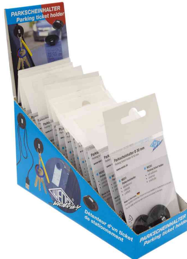
Parkschein-Universalhalter-Set, 15er Display