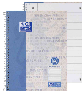
Collegeblock Recycling, liniert