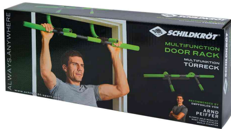
Multifunktionales Türreck 4in1, Verpackung