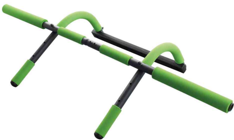
Multifunktionales Türreck 4in1

- sowohl für Klimmzüge und Liegestütze, als auch zum Training der Trizepsmuskulatur