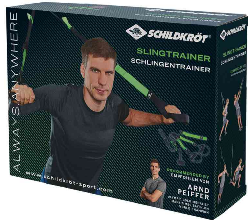
Sling Trainer, Verpackung